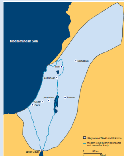
Kong Davids og kong Salomons Rige, ca. 990 – 930 fvt.

Selv i de mange hundrede år, hvor der ikke var en jødisk stat, havde begrebet ” eretz Israel ”, der bedst kan oversættes med Israels land , en stor betydning for alverdens jøder. Det henviser til det område, hvor den jødiske tro opstod, de jødiske forfædre levede, og hvor man stadig århundrede efter århundrede håbede og ønskede at vende tilbage til.