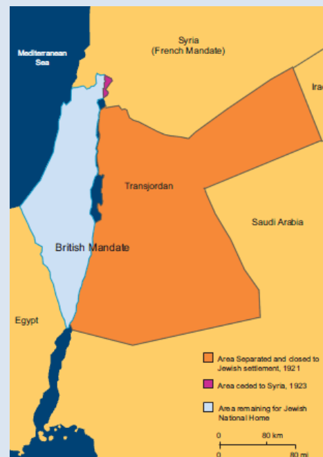
Mandatområdet efter Transjordanien blev selvstændigt kongedømme. Jøder kunne nu kun bosætte sig i Palæstina, ikke i Transjordanien