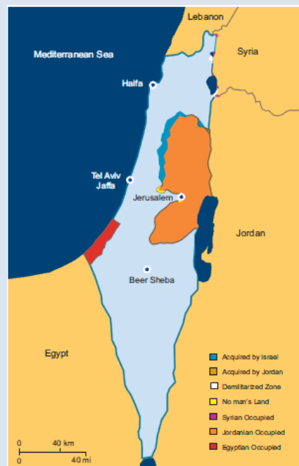
Våbenhvilestillingen fra 1949