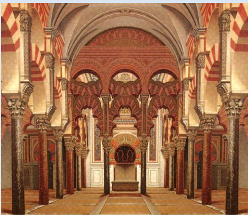
Mezquita-katedralen i Cordoba blev oprindeligt bygget som en moske

Araberne kom til området ca. år 630, da muslimerne erobrede den arabiske halvø, og bortset fra den kristne korsfarerperiode i årene 1099 – 1291 var området en del af det arabiske kalifat frem til 1516, hvor tyrkerne erobrede området og gjorde det til en del af Det Osmanniske Rige frem til første verdenskrigs afslutning i 1918.