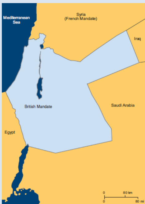
Det britiske mandatområde, som briterne fik efter 1. verdenskrig. Briterne kaldte området Palæstina

Efter 1. Verdenskrig 1914 – 18 fik de tabende lande frataget store landområder. England og Frankrig var blandt vinderne, mens Tyskland og Tyrkiet var blandt taberne. Derfor overtog England og Frankrig magten over dele af Mellemøsten og trak nogle mere eller mindre tilfældige grænser og oprettede nye stater. England fik bl.a. de landområder, som vi i dag kender som Jordan, Israel og de palæstinensiske selvstyreområder og kaldte det ”mandatområdet Palæstina”. Alle borgerne i området fik palæstinensisk statsborgerskab, uanset deres religion og afstamning. Jøder, kristne, muslimer, arabere, drusere og beduiner, alle blev de palæstinensere. De første ledere af staten Israel, fx David Ben Gurion og Golda Meir blev også palæstinensere med palæstinensiske pas. I 1921 delte englænderne Palæstina i to dele, det selvstændige kongedømme Transjordanien, i dag kaldet Jordan, øst for Jordanfloden, mens landet vest for floden stadig blev kaldt Palæstina og stadig var under engelsk styre.