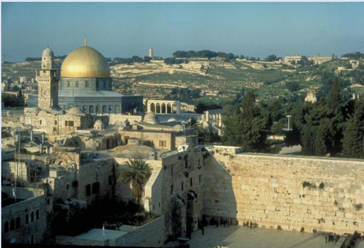
Jerusalem med "Grædemuren" i forgrunden. Muren er det eneste, der i dag er tilbage af det jødiske tempel, der blev bygget af kong Herodes og ødelagt af romerne i år 70 e.v.t.

* http://www.shalomjerusalem.com/jerusalem/jerusalem3.htm .