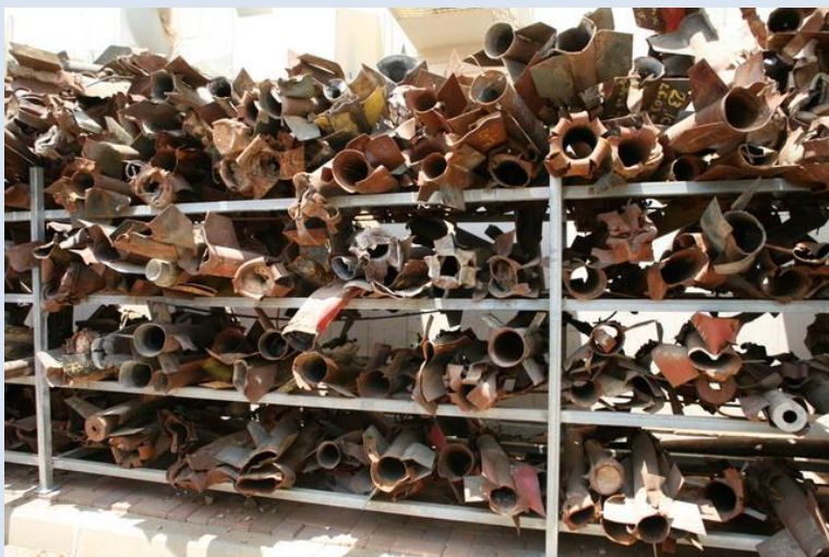
Resterne af nogle af de raketter, der fra Gaza er sendt over den israelske by Sderot

Derfor angreb Israel i december/januar 2008/2009 Hamas i Gaza for at stoppe regnen af raketter ned over israelske byer. Der kommer dog stadig raketter fra Gaza ind over det sydlige Israel, men ikke så mange som før. Af hensyn til at sikre sine borgere mod angreb fra Hamas, ser Israel sig tvunget til at undersøge alle forsyninger ind til Gaza for at forhindre, at der smugles våben ind til Hamas.