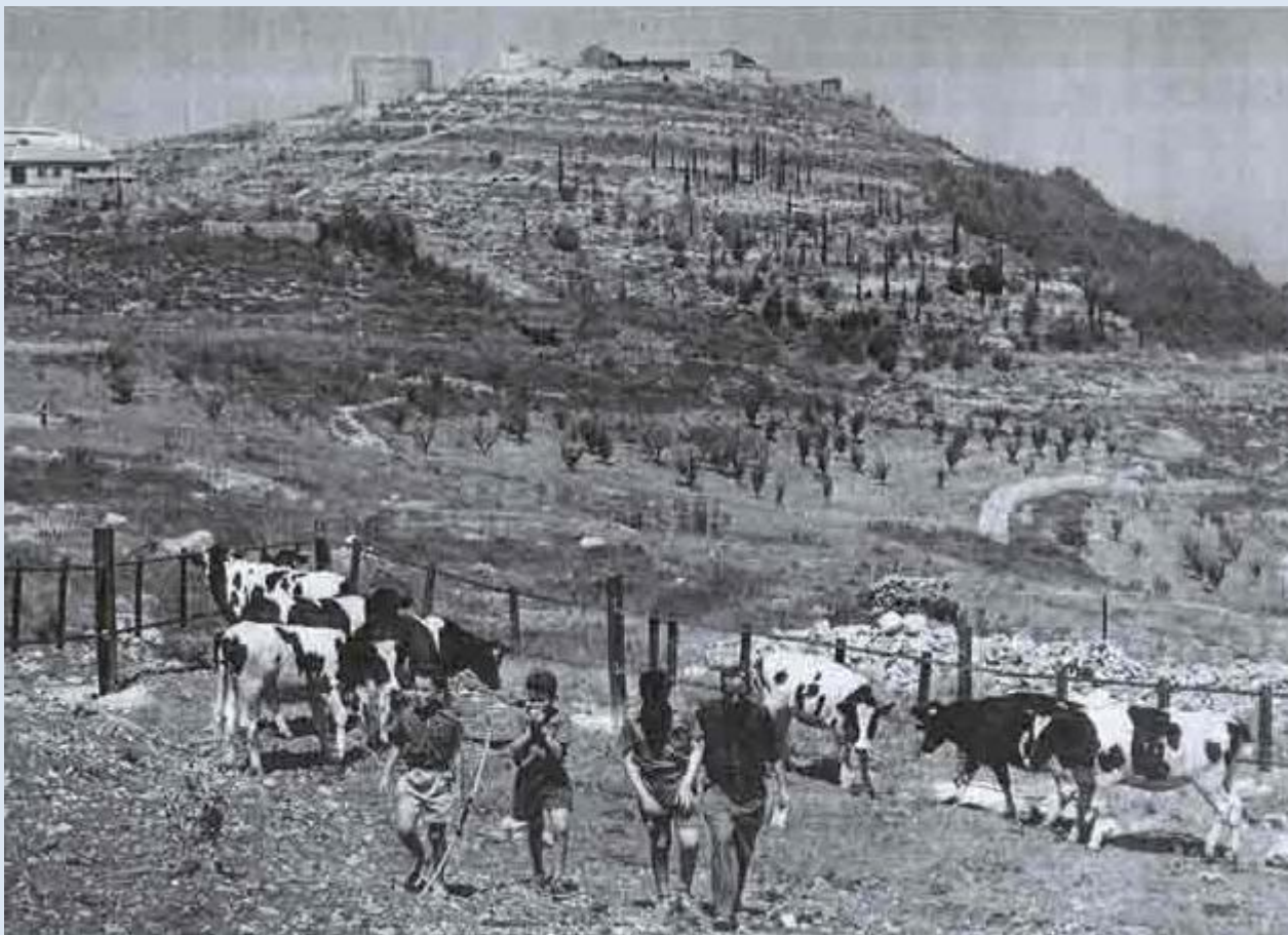
Mange jøder, der kom til Palæstina i perioden 1880 - 1930, oprettede kibbutzer, der opdyrkede landet

Pga. den arabiske modstand mod jødisk indvandring lavede englænderne stramme kvoter for indvandringen. En tragisk følge blev, at jøder, der forsøgte at flygte fra nazisternes forfølgelser i Europa i 1930’erne og 1940’erne, ikke fik lov til at komme ind i mandatområdet Palæstina, og mange blev i stedet dræbt af nazisterne. Englænderne opretholdt kvoterne frem til 1948, hvor de trak sig ud af mandatområdet.