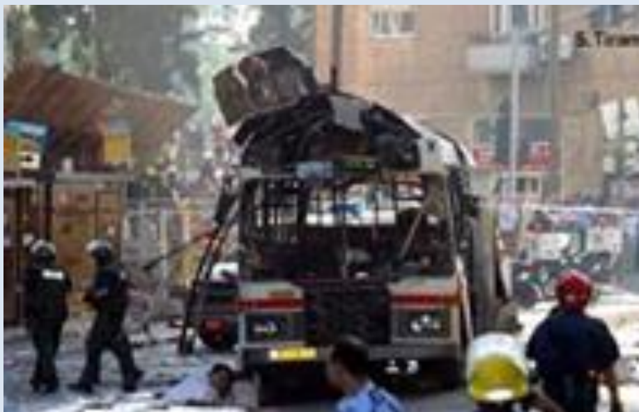
En bus med civile er blevet terrorbombet.

Efter Israel blev dannet i 1948, blev mange israelere angrebet af forskellige arabiske kampgrupper med støtte fra flere arabiske regeringer. I 1964 blev PLO, Palestinian Liberation Organization , dannet som en paraplyorganisation for flere terrorgrupper med Yassir Arafat som leder og med det formål at ”smide jøderne i havet.” Men det var først i 1967, altså tre år efter PLO blev dannet, at Israel erobrede Sinai, Vestbredden, Østjerusalem, Gaza og Golan i en krig. Israel tilbød kort efter krigen i 1967 at give områderne tilbage mod til gengæld at få en fred med de arabiske nabolande – svaret kom 3 måneder senere fra et arabisk topmøde i Khartoum: ”nej til fred, nej til forhandling, nej til anerkendelse af Israel.”