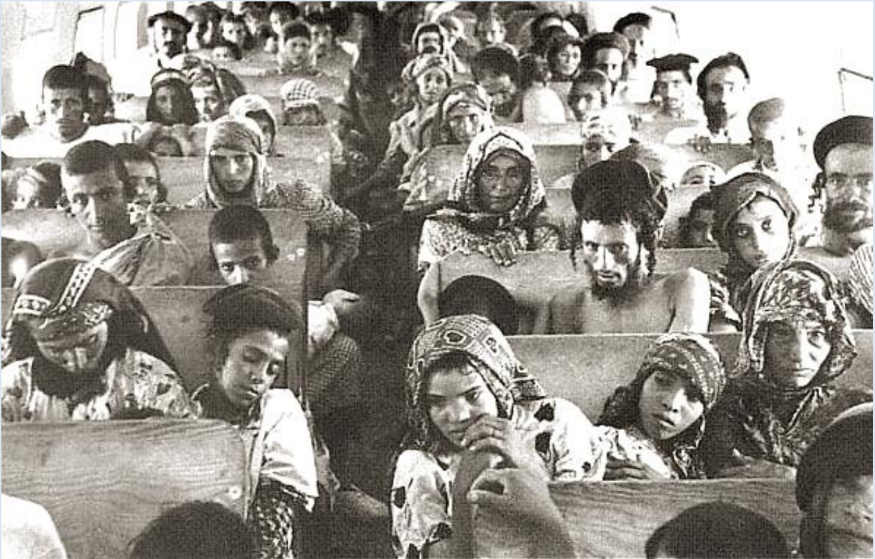
Jødiske flygtninge fra Yemen bringes til Israel.

Siden FN blev skabt i 1945, har verden oplevet mange krige, og mange millioner mennesker har oplevet at være flygtninge. Det er altid en stor tragedie, men de fleste tragedier er blevet løst ligesom det jødiske flygtningeproblem – man har fundet nye hjem og er blevet integreret i nye samfund. De palæstinensiske flygtninge er de eneste, hvor flygtningene fastholdes som flygtninge.