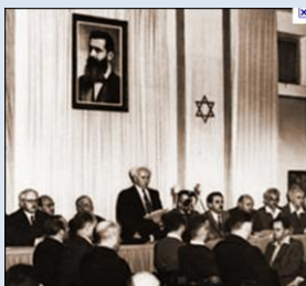
David Ben Gurion udråber den nye jødiske stat Israel

Gennem 1930'erne kom flere forskellige forslag til en løsning af striden mellem jøderne og araberne, bl.a. Peel kommissionens delingsforslag, der ville dele landet i en jødisk stat, en arabisk stat og et område under fortsat engelsk styre. Jøderne sagde modvilligt ja, mens araberne sagde nej, og striden og volden tog til. Englænderne kunne ikke længere holde ro i området og bad FN finde en løsning. På FN's generalforsamling den 29. november 1947 vedtog forsamlingen med 33 stemmer for, 13 stemmer imod og 10 blanke stemmer resolution 181, der delte mandatområdet Palæstina i et jødisk Palæstina og et arabisk Palæstina.