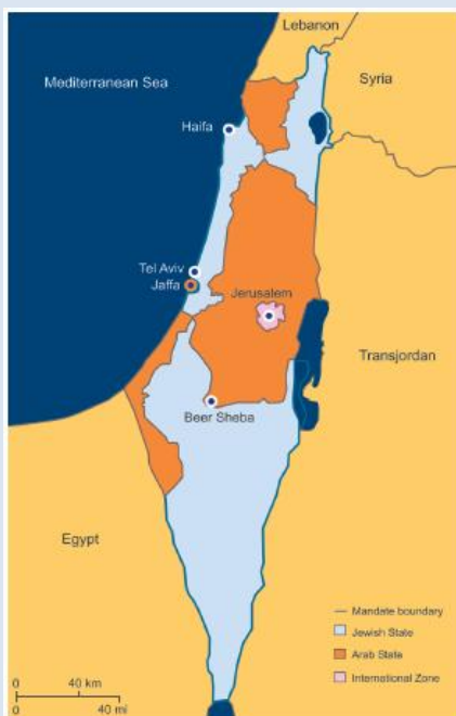
FN's delingsplan fra 1947

Det arabiske Palæstina blev aldrig dannet, som hensigten var i FN resolution 181 fra 1947. I stedet blev området besat af og indlemmet i Egypten og Jordan indtil 6-dages krigen i 1967, hvor Israel overtog ansvaret for områderne.